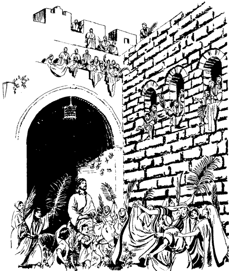
Jesuta nüke juta Jerusalénte (Marcos 11.1-11)

Juta tuen kánime ni ngware ta. Se kánti mun nän. Mun raba yete angwane, buro ngábäli näkwita ngämi kwan mäkäninte munye, ye tikate munkwe, bti mun jata ngwena tie. 3 Akwa