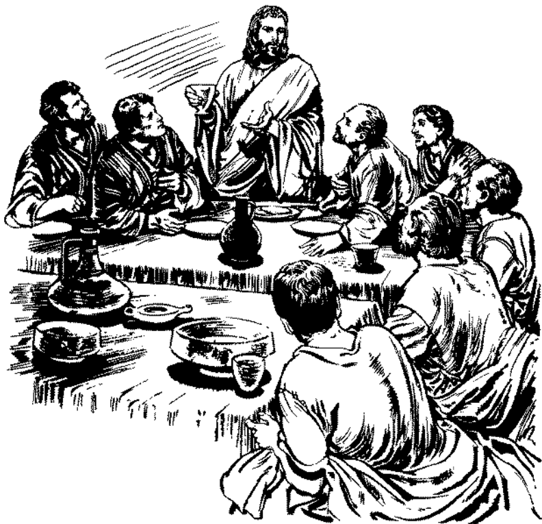
Jesuta mröre mrä nitre ja töitikaka benbe (Marcos 14.12-23)

23 Bti uba döi nämane basote abko Jesukwe diani kisete, bti kuin niebare btä kwe Ngöböye, bti biani kwe ietre. Niaratre